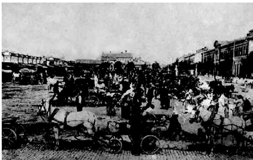
Piața Chișinăului (după Retro Chișinău )